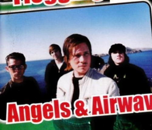
Angels & Airwaves