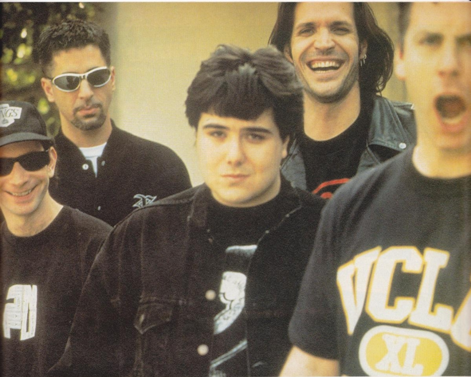
Greg Hetson, Brett G., Bobby Schayer, Jay Bentley & Greg Graffin: van Heerenveen naar Ajax

lijks aan de telefoon hangt. Vraag is echter of de overstap naar Sony hiervoor wel nodig was. Want Bad Religion had z'n kont nog niet gekeerd of Epitaph verkocht maar liefst 1 miljoen CD's van Offspring. En lijkt nog veel meer geld te gaan maken. Want heel jong, blank Amerika is momenteel in de ban van de zogenaamde Second Wave Of Punkrock.