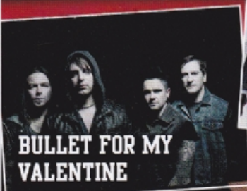
BULLET FOR MY VALENTINE