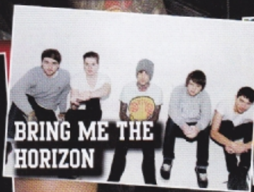
BRING ME THE HORIZON