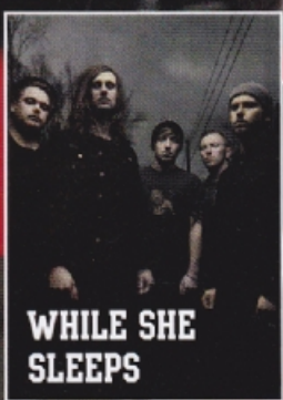
WHILE SHE SLEEPS